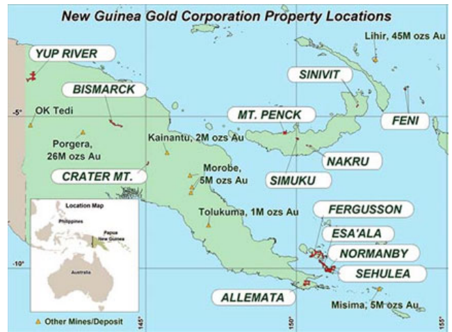
Lageplan der Projekte New Guinea Gold

Imwauna besticht in vielerlei Hinsicht, vor allem jedoch in folgenden Punkten: die historische Ressource, basierend auf lediglich 15 Bohrungen, von 194`000 Unzen Gold und 382`000 Unzen Silber; die geologischen Ähnlichkeiten zur Misima Mine von Placer Dome (5 Mio. Unzen Gold) sowie die Möglichkeit, sowohl über, als auch unter Tage das Gold zu fördern, bei Goldgehalten von 8 g/t bzw. 15,5 g/t; Der bislang beste Goldgehalt im Imwauna Projekt beträgt 438 g/t + 485 g/t Silber. Für Imwauna liegt noch keine Ressourcenschätzung in Übereinstimmung mit NI 43-101 vor, doch aufgrund der durchgehend hervorragenden Bohrerergebnisse kann man davon ausgehen, dass die historische Ressourcenangabe erreicht, möglicherweise sogar übertroffen werden könnte.